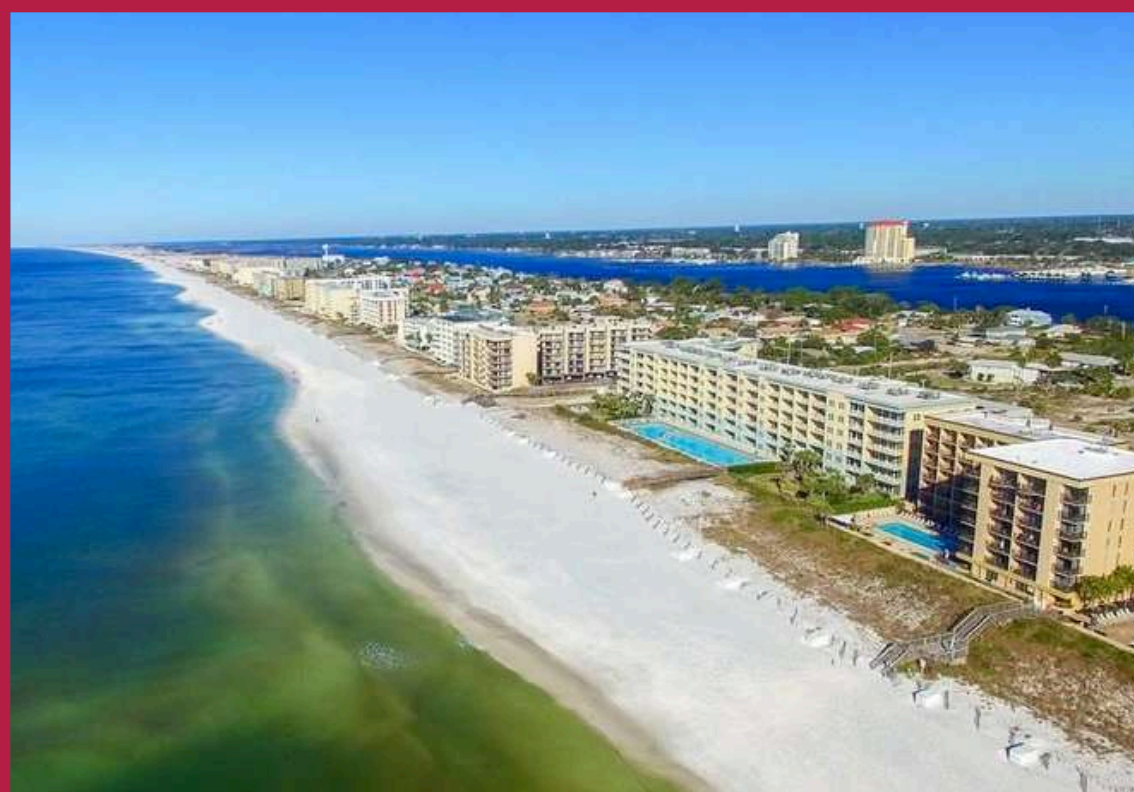
FORT WALTON BEACH