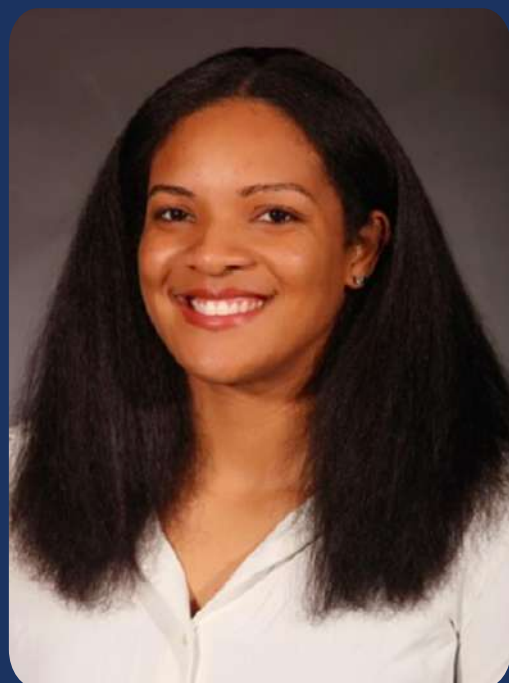
Jaleesa Harper Glavni trener

Jaleesa Harper, koja je prethodno bila pomoćni trener od 2018. do 2022. godine, imenovana je glavnim trenerom UNC 25. januara 2023. Pridružila se timu kao pomoćni trener na postdiplomskim studijama 2018. godine, zatim postala privremeni pomoćni trener 2019-2020, a stalni pomoćni trener 2021. godine.